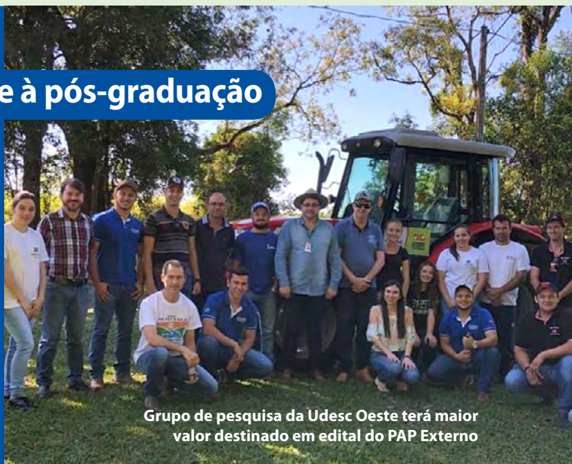
Grupo de pesquisa da Udesc Oeste terá maior valor destinado em edital do PAP Externo

▶ Pelo Programa de Internacionalização da Pós-Graduação (Proint-PG) , foi lançado novo edital, com inscrições em 2019. [LEIA+]