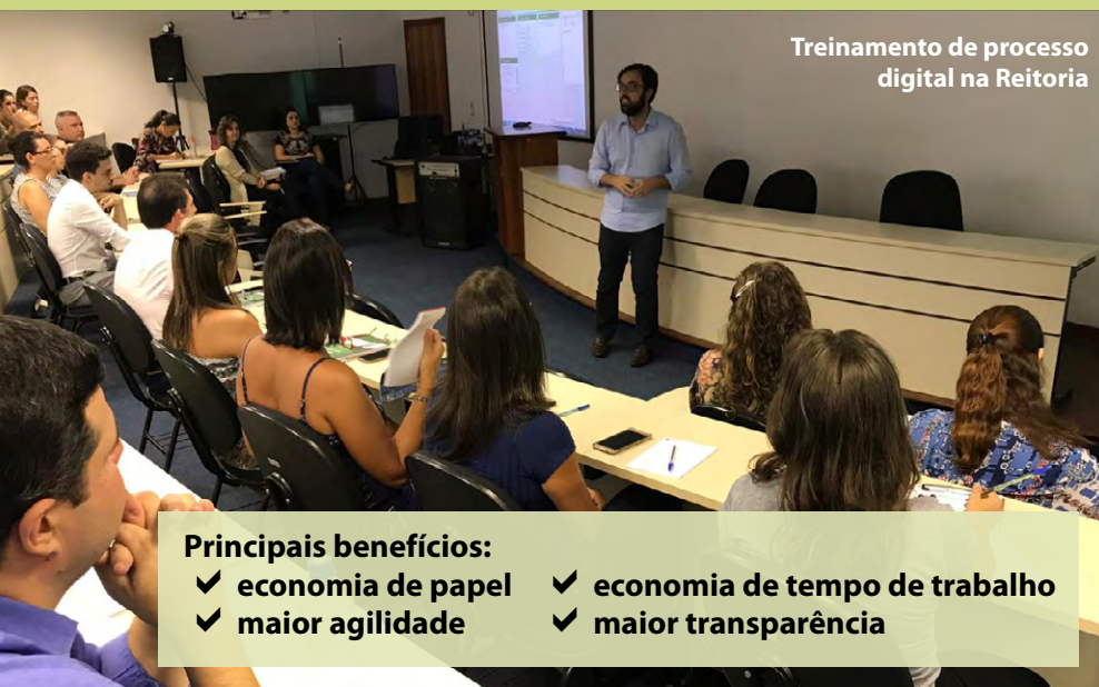
Treinamento de processo digital na Reitoria

Central de Ajuda do SGP-e , com vídeos explicativos sobre como ocorrerá a mudança, como trabalhar com processos digitais e os passos para conversão dos processos físicos.