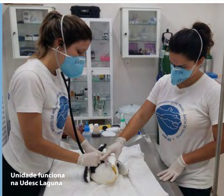
Unidade funciona na Udesc Laguna

◆ Mais seis gaivotas com intoxicação botulínica, resgatadas em abril, foram estabilizadas pela equipe da Unidade de Estabilização da Fauna Marinha do Sul Catarinense, da Udesc Laguna. A unidade integra um projeto nacional, ligado à Petrobras, e conta com instalações inauguradas em 2017, na Praia do Gi. Primeiro do gênero na região, o espaço é usado para resgate, tratamento e reabilitação de aves, répteis e mamíferos marinhos, e conta com uma equipe multiprofissional. Desde a implantação do projeto, 208 aves foram encontradas com suspeita de intoxicação e 113 foram estabilizadas com sucesso. [LEIA+]