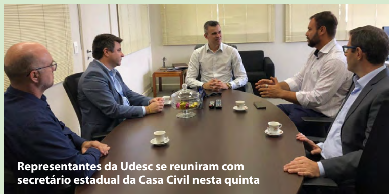
Representantes da Udesc se reuniram com secretário estadual da Casa Civil nesta quinta

Mais de dez câmaras municipais em SC aprova-